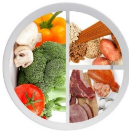
Figuur 1 verhoudingen op het bord, tip voor het opscheppen

Geef de tips voor het opscheppen ook mee aan leerlingen die zichzelf mogen bedienen.